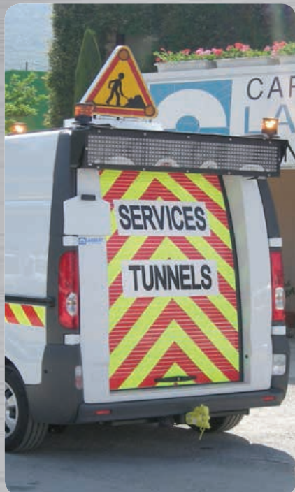
Panneaux à messages variables (PMV) sur pavillon ou en applique sur face arrière